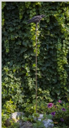
Mazoy, Ana. S/título, 125x32x25 cm. Año 2013. Fundición y piedra.