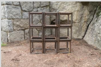
GARAY, ISABEL. De la Serie Aire Armado I, 75x75x25 cm. Año 1973. Acero corrugado.