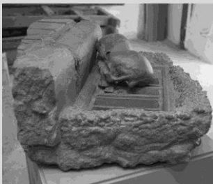
Encinas, Javier. "Nido", 72 x 65 x 32 cm. Año 2013. Año 2013. Hormigón de basalto.