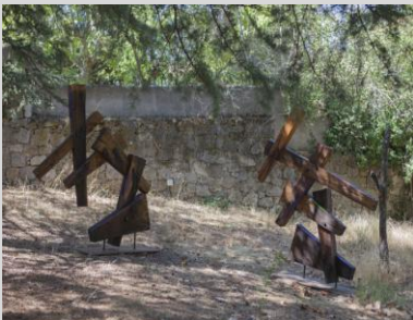
González, David. "Grave-edad 68", 180x125x50 cm. Año 2011. Madera con base de hierro.