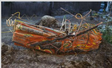
Job, Thierry. Shítúta, 160x55x70 cm. Año 1984. Madera, hierro, pintura, barniz.