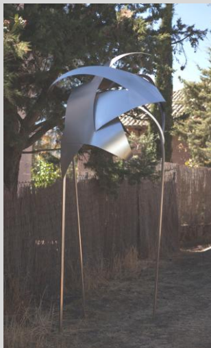
Solis, Mar." Espacios brotados", 270x140x150 cm. Año 2008. Acero inoxidable.