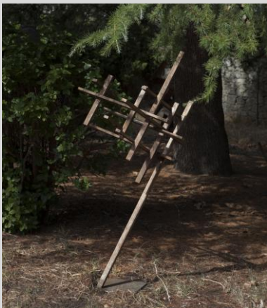
Sánchez Molina, José Luis. "Encuentros", 170x100x90 cm. Año 2007. Soldadura y hierro.