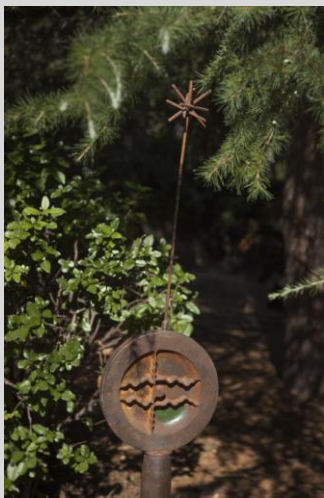
Valle, Antonio."Disco-estrella Solar", 200x46x35 cm. Año 1998. Hierro forjado, y esmalte.