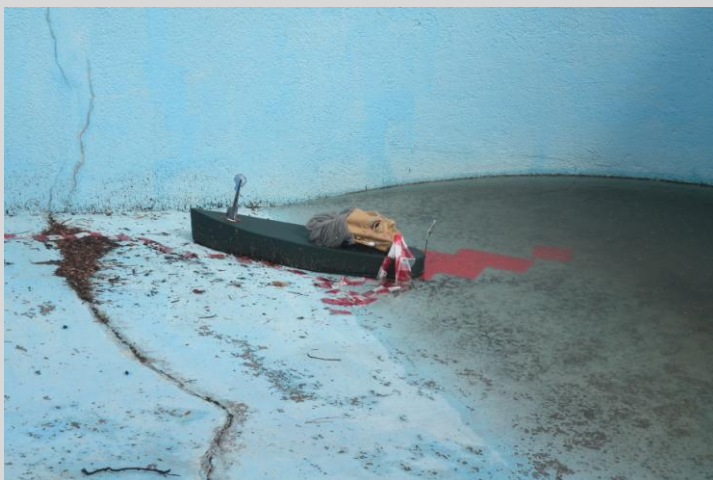
Ugalde, Juan." Caciquismo", instalación. Barcaza de chapa, pintura, máscara, cinta plástica, agua. Medidas variables. Año 2013.