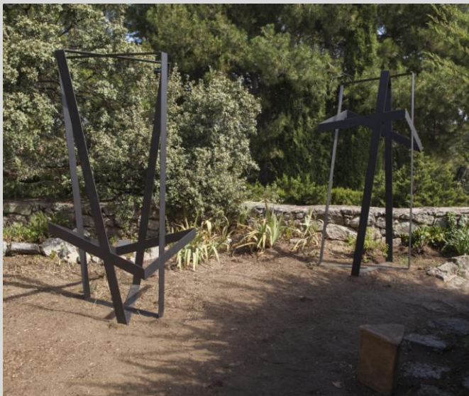
Zvonimir. "Asimetrías", 195x85x81 cm. Año 2013. Acero y vacío.