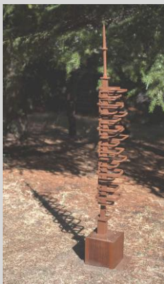
Nuez, Julio. "Skyline 2", 206x34x26 cm. Año 2013. Hierro lacado, base madera de Iroko.