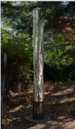
Fragua, Fernando. "Cuerpo luminoso. Vacío falso" 300x40x40 cm. Año 2013. Metacrilato, aluminio, hierro, luz.