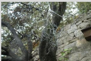
González, Santiago. "Patrón de crecimiento", 110x110x110 cm . Año 2013. Alambre galvanizado.