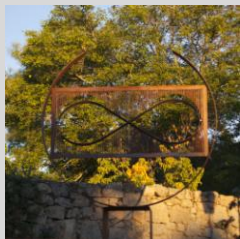
Aumente, Jaime. "Tiempo Lemniscata", 220x250x50 cm. Año 2013. Hierro y acero.