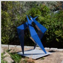
Fernández Santos, Raquel. "Grullas por Fukushima II", 200x130x100 cm. Año 2012. Hierro y acero inoxidable