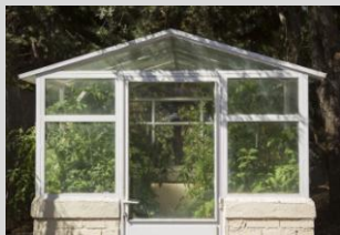
Invernadero y Huerto de "Un Proyecto sobre biodiversidad" de Francisco Felipe Figueroa. Obra en proceso. Se inició el Proyecto en mayo de 2013 y se inauguró con la dedicación de este espacio a José Félix de Azara el 22 de Junio del mismo año.