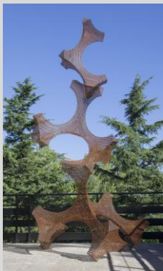
Canogar, Diego. "Tetramorfo perforado", 420x200x150 cm. Año 2013. Acero corten