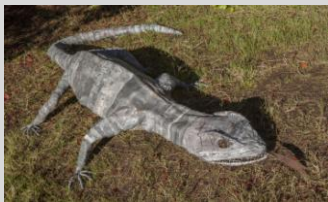
Sanz de la Fuente, Agustín. "Salamandra", 360x32x100 cm. Año 2013. Hierro y plomo.