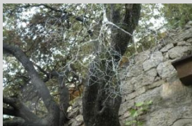
González, Santiago. "Patrón de crecimiento", 110x110x110 cm. Año 2013. Alambre galvanizado.