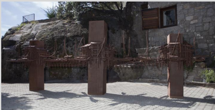
Suarez, Fernando. "Aldeas Flotantes 4.0", 190x560x185 cm. Año 2013. Acero corten.