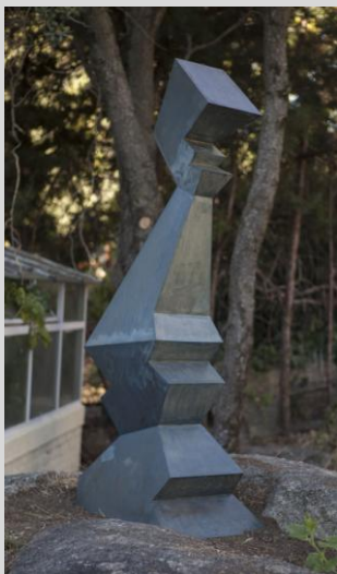
López, Nacho. "Dama de agua", 150x53x35 cm. Año 2009. Acero soldado y patinado.