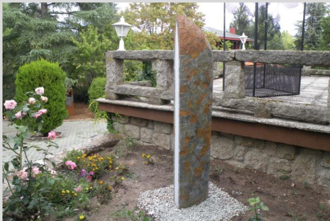
Yamaoka. "Tamasi", 275 x 15 x 36 cm. Año 1987/88. Madera, plomo, grapas, tarlatana.