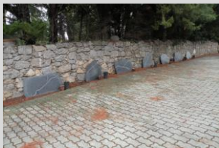
Figueras, Francisco Felpe. "Robledo" instalación. Dimensiones variables. Año 2012 / 2013.