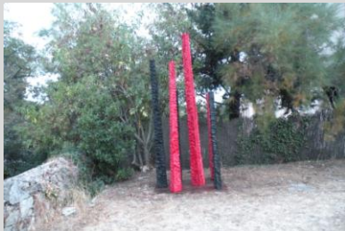
González, David. "Vos-que", 300x140x100 cm. Año 2011. Madera policromada.