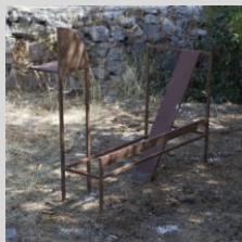
Camp, Joaquín. S/título, 73x60x43 cm. Año 1987. Hierro pavonado.