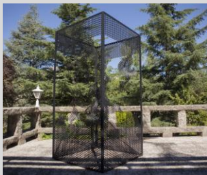
Czili. Gran Implosión", 200x100x100 cm. 100 cm. Año 2013. Hierro pintado.