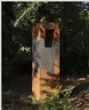
Cobertera, Emilio. S/título, 220x60x50 cm. Año 2012. Acero Corten e inoxidable.