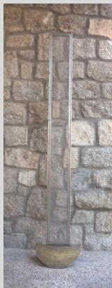
Parrilla, Emilio. 246x26x30 cm. Año 1900. Red metálica, acero y bronce.